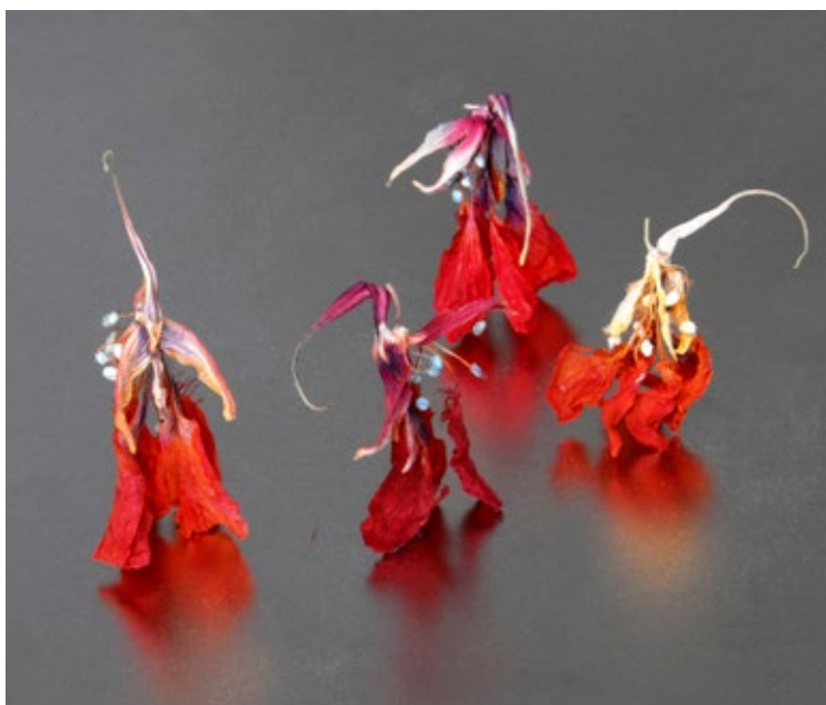
SUZUKI Nanaé: In Szene 70 , 45 x 65 cm, Fotodruck, 2009

chungen und Spiegelungen entstanden parallele Räume und unterschiedliche Zeiten in einem Bild. Durch diese Erfahrung entwickelte sich meine Art, Bilder zu finden und zu malen.