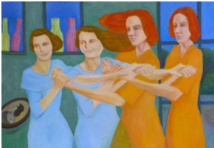
SUZUKI Nanaé: Handgreiflichkeit , 52 x 74 cm, Öl auf Karton, 2015

N.S.: Bei meinen Bildern entstehen die Wiederholungen in unterschiedlichen Prozeduren. Diese Reihe von Arbeiten hat 2011 angefangen. Die Hausfrau aus einem Spielfilm wiederholte sich in einer Linse oder durch Brechungen. Durch diesen Prozess holte ich das Bild aus seinem ursprünglichen Kontext heraus. Durch diese Stufe erreiche ich die Nächste. So kommt die erste Gruppe: Ein Bild mit Linse oder durch Wasser sich wiederholen lassen. Oder wie trenne ich ein Bild in zwei Bilder, das eine mit dem rechten Auge gesehen und das andere mit dem linken. In beiden Bildern ist plötzlich eine Bewegung,