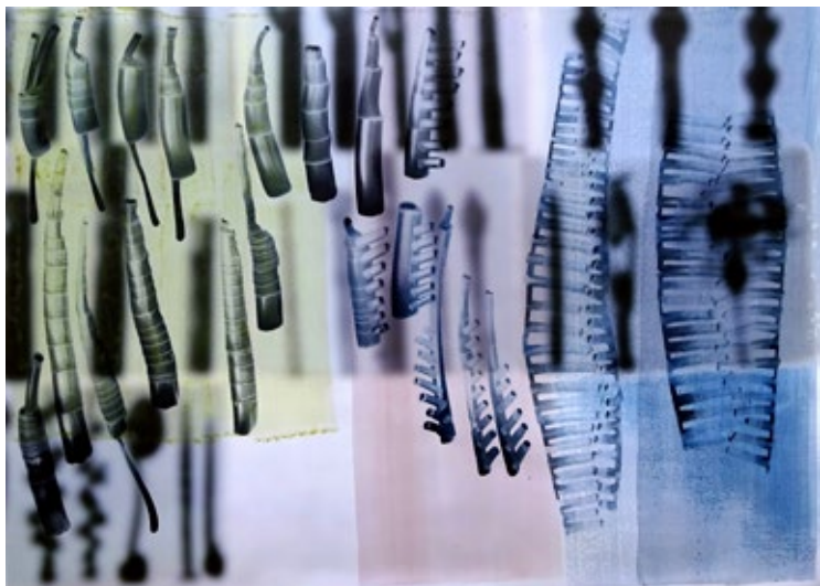
Eva-Maria SCHÖN: Paralleles Wachstum 1 , 60 x 80 cm, Tusche auf Fotodruck, 2015

E.M.Sch.: Die Kamera in meiner Hand ist ein Bildeinfänger, zum Beispiel bei den „Gedächtnislücken“. Was vor meinen Augen passiert, ist wie ein Wunder an Gegenwärtigkeit. Bei meinen Papierarbeiten sehe ich ganz nah vor Augen, welches Loch mein Atemstoß in der Tusche verursacht – Explosionen, die trocknen. Die Kamera beobachtet den Mund, der den Atem verlässt, die kurze Spanne beim Ausatmen und Einat- men. Ich kann sie zwar spüren, aber sehen möchte ich sie und wie der Atem zum bewegten Bild wird.