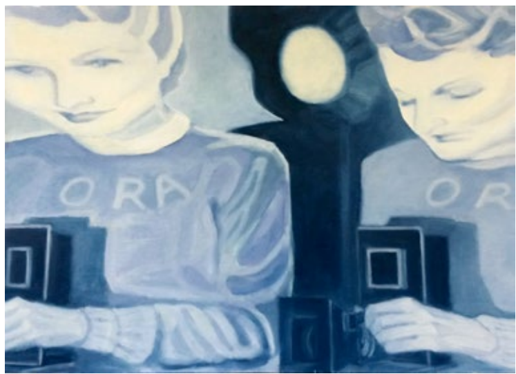
SUZUKI Nanaé: Frau mit Kamera , 37 x 52 cm, Öl auf Karton, 2015